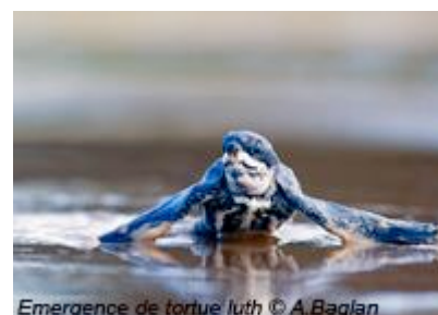
Emergence de tortue luth