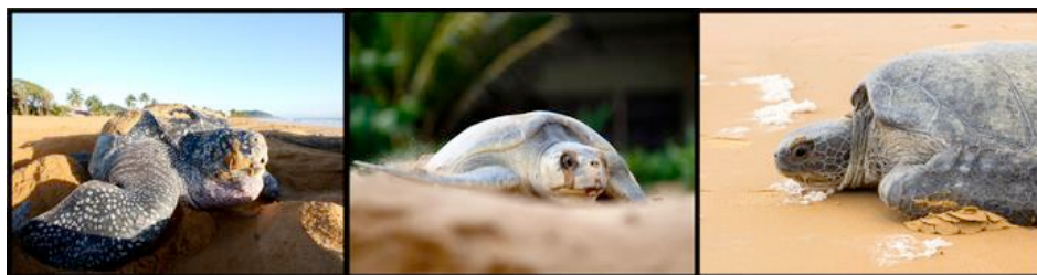
Tortue luth, tortue olivâtre et tortue verte

C'est en 1998 que l'association Kwata a mis en évidence l'importance des plages de l'île de Cayenne comme sites de ponte majeurs pour les tortues olivâtre et luths. Depuis, un important programme de conservation a été mis en œuvre en impliquant de nombreux bénévoles.