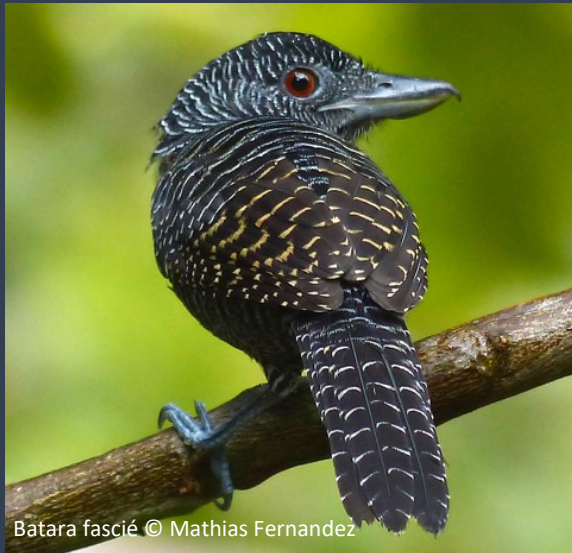
Batara fascié

Toute l'équipe du GEPOG vous souhaite une belle année 2020 et vous remercie d'être toujours fidèles au rendez-vous lors des activités et dans la vie de l'association.