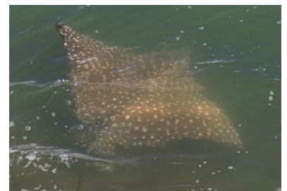
Raie léopard au Grand-Connétable

Entre septembre 2018 et avril 2019, une synthèse des connaissances sur les élastomobranques en Guyane a été rédigée par le GEPOG. Cette action, qui faisait également partie du plan de gestion de la réserve, a permis de mettre à jour la liste des espèces, d'identifier les menaces et enjeux qui pèsent sur elles et de mettre en évidence et les actions prioritaires à envisager.