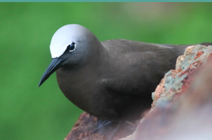
Noddi brun

Chaque année, la Journée mondiale des zones humides (JMZH) est célébrée le 2 février, pour commémorer la signature de la Convention sur les zones humides, le 2 février 1971, dans la ville iranienne de Ramsar. En 2020, le thème de cette journée sera « zones humides et biodiversité ». Retrouvez dans notre calendrier les activités proposées dans le cadre de cet évènement.